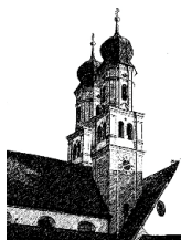
Mariä Himmelfahrt Niederschönenfeld