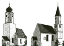
St. Jakobus – St. Georg Unterpeiching Mittelstetten