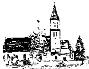
St. Georg – Feldheim