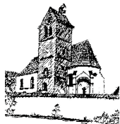
St. Quirin – Staudheim