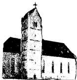
St. Peter und Paul Genderkingen